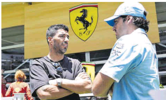
Luis Suárez departe con Carlos Sainz durante la previa del GP de Miami